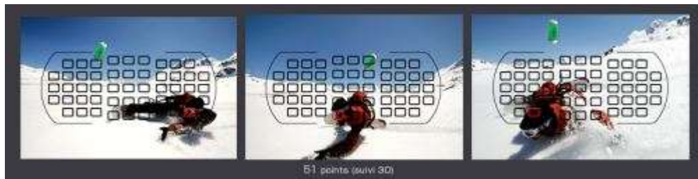
Suivi 3D sur 51 points

Le mode de zone AF Suivi 3D fonctionne sur un principe proche des précédents mais inclut détection de couleur et intensité de la lumière pour assurer le suivi du sujet. Le suivi 3D est ainsi nommé car il tient compte de l'angle d'incidence des rayons lumineux arrivant sur l'objectif pour optimiser la mise au point.