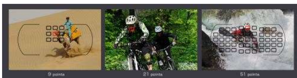
Regroupement des collimateurs par groupes de 9, 21 ou 51 points

Utiliser plus de points demande un temps de traitement de l’information plus long pour le module AF. Ce mode de zone à 21 points peut donc s’avérer un peu moins réactif que celui à 9 points ou que le mode AF sélectif.