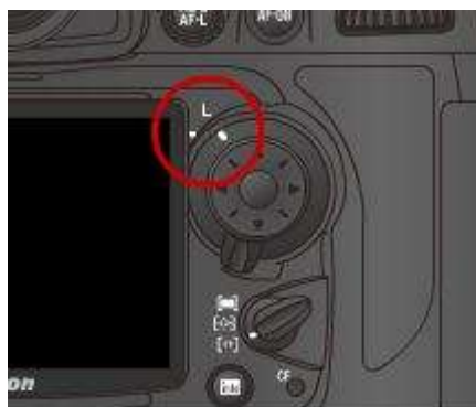
verrouillage du choix du collimateur – position L du pad arrière