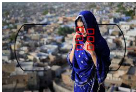
Mode AF-A avec détection auto du sujet

L'affichage ne change pas, c'est toujours AF-A qui est indiqué puisque la bascule entre les deux modes peut se faire à tout instant. Ce mode vous permet de vous affranchir d'un choix personnel en laissant le boîtier travailler à votre place.