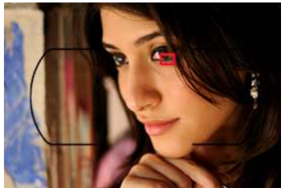
Mode zone AF Sélectif – 1 collimateur utilisé

C'est le mode le plus simple puisqu'un seul collimateur est mis en jeu. Vous choisissez le collimateur qui désigne au mieux votre sujet à l'aide du pad arrière et c'est celui qui sera utilisé par l'AF pour effectuer la mise au point.