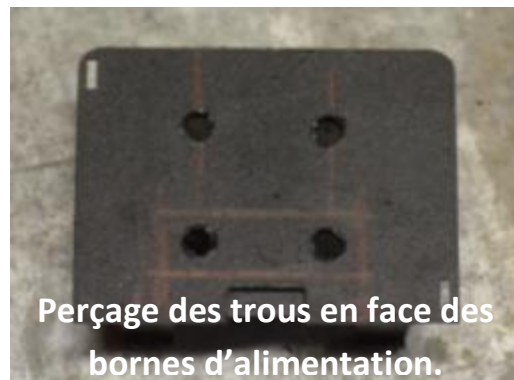
Perçage des trous en face des bornes d'alimentation.

Positionnement lame ressort (calle miroir de vidéoprojecteur)