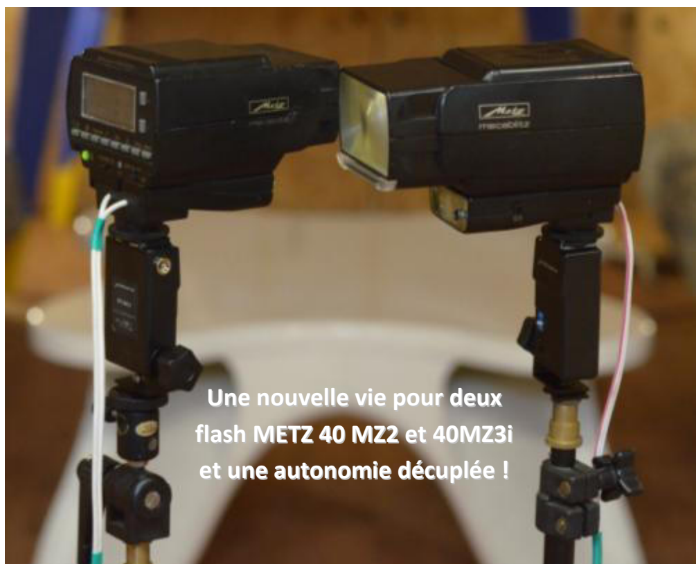
Une nouvelle vie pour deux flash METZ 40 MZ2 et 40MZ3i et une autonomie décuplée !