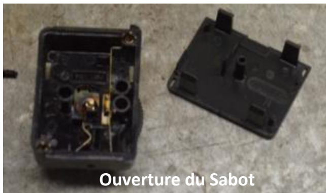
Ouverture du Sabot

Adaptation d'une alimentation par batterie 6V – 4A dans un sabot de flash SCA